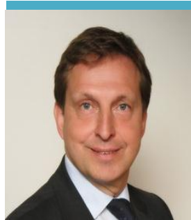
Черных А.Н., Законодательное Собрание Санкт- Петербурга