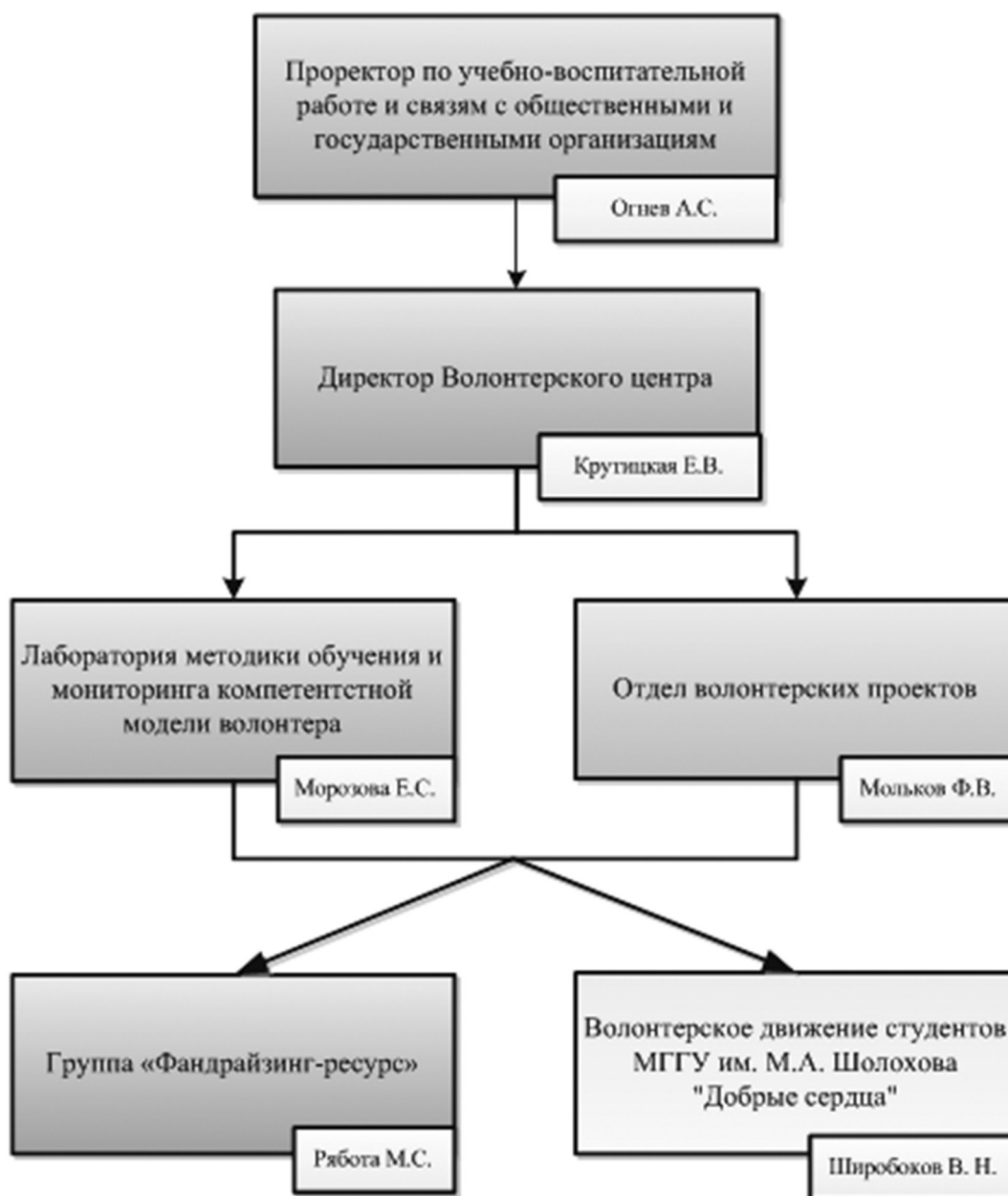
Схема 2 Организационная структура Волонтерского центра МГГУ им. М.А. Шолохова

Ожидаемые результаты функционирования Волонтерского центра, такие как создание эффективной системы управления волонтерской деятельностью в вузе, создание новых образовательных методик подготовки волонтеров в РФ, создание образовательных программ подготовки волонтеров для участия в проведении мероприятий в сфере служения обществу, в том числе спортивных мероприятий, разработка механизмов вовлечения молодых людей в волонтерскую деятельность, разработка компетентност-