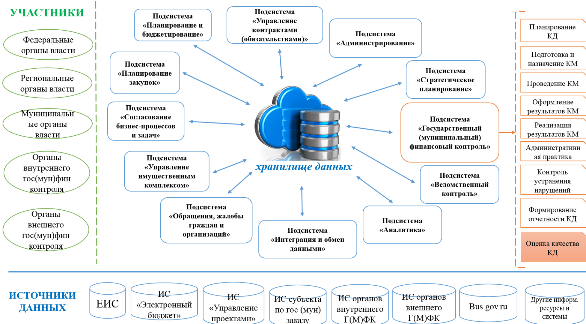
Рисунок 3 – Архитектура единой платформы государственного управления