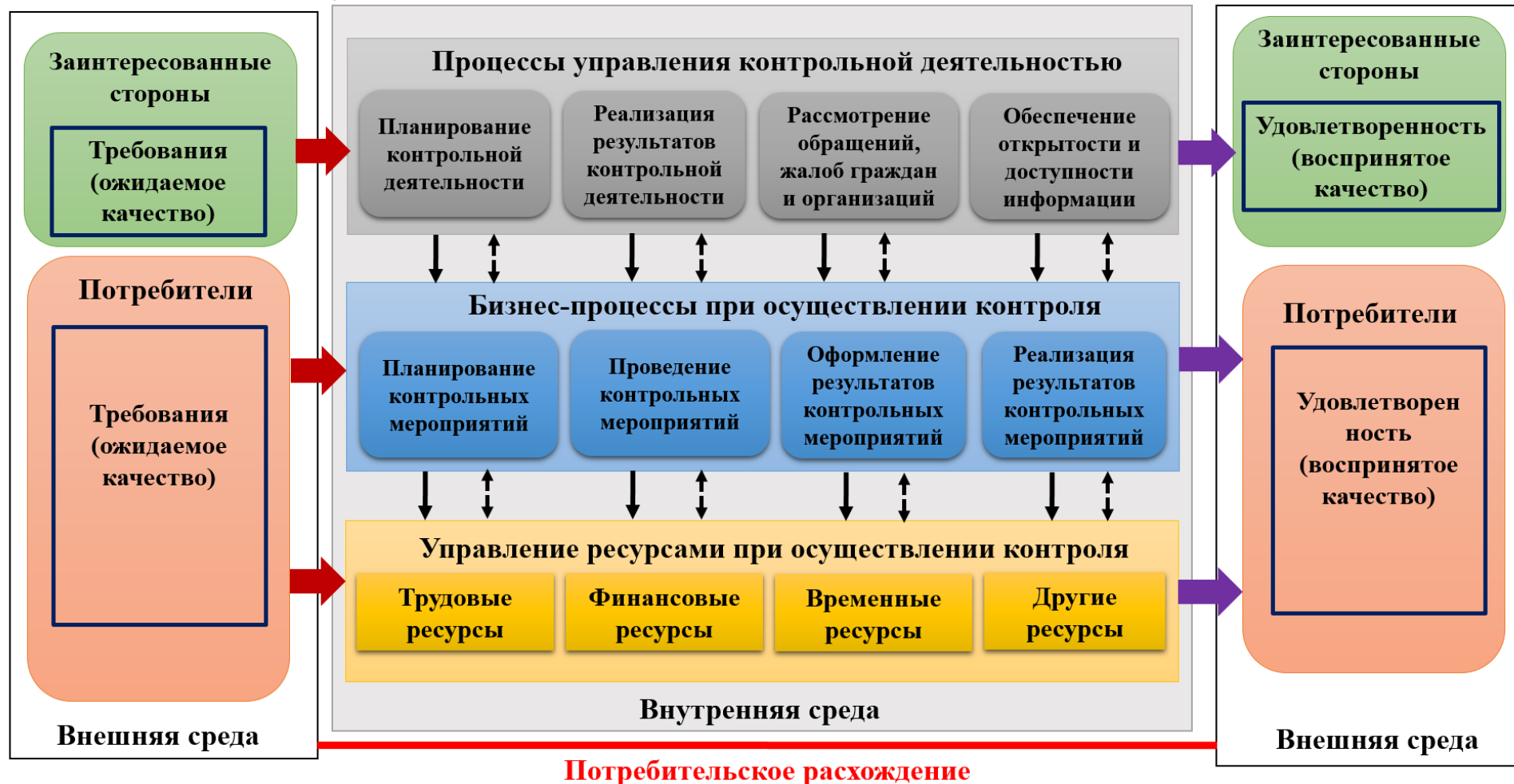
Рисунок 2 – Модель обеспечения качества контрольной деятельности в сфере закупок