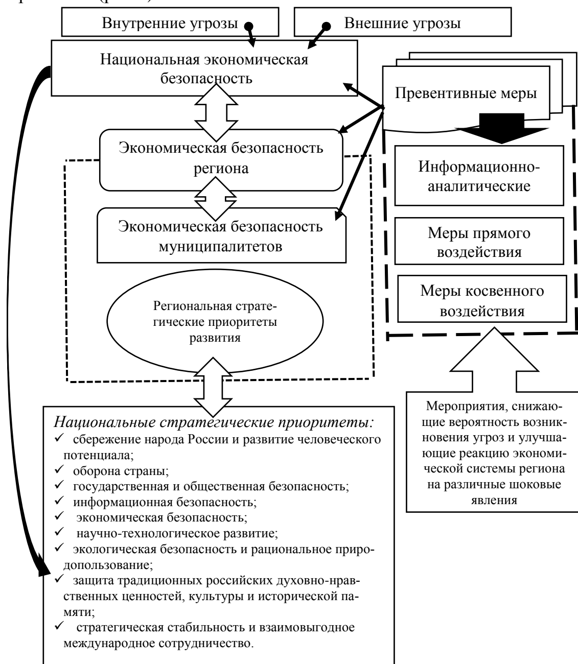
Рисунок 1 - Модель экономической безопасности региона

Данная трактовка помимо текущего и перспективного положения экономической системы региона учитывает инструменты бенчмаркинга, что несомненно положительным образом отразится на системе проектного управления региона, так как позволяет учесть комплекс мер, направленных на устранение рисками при реализации региональных и федеральных национальных проектов на уровне отдельных регионов (рис.1).