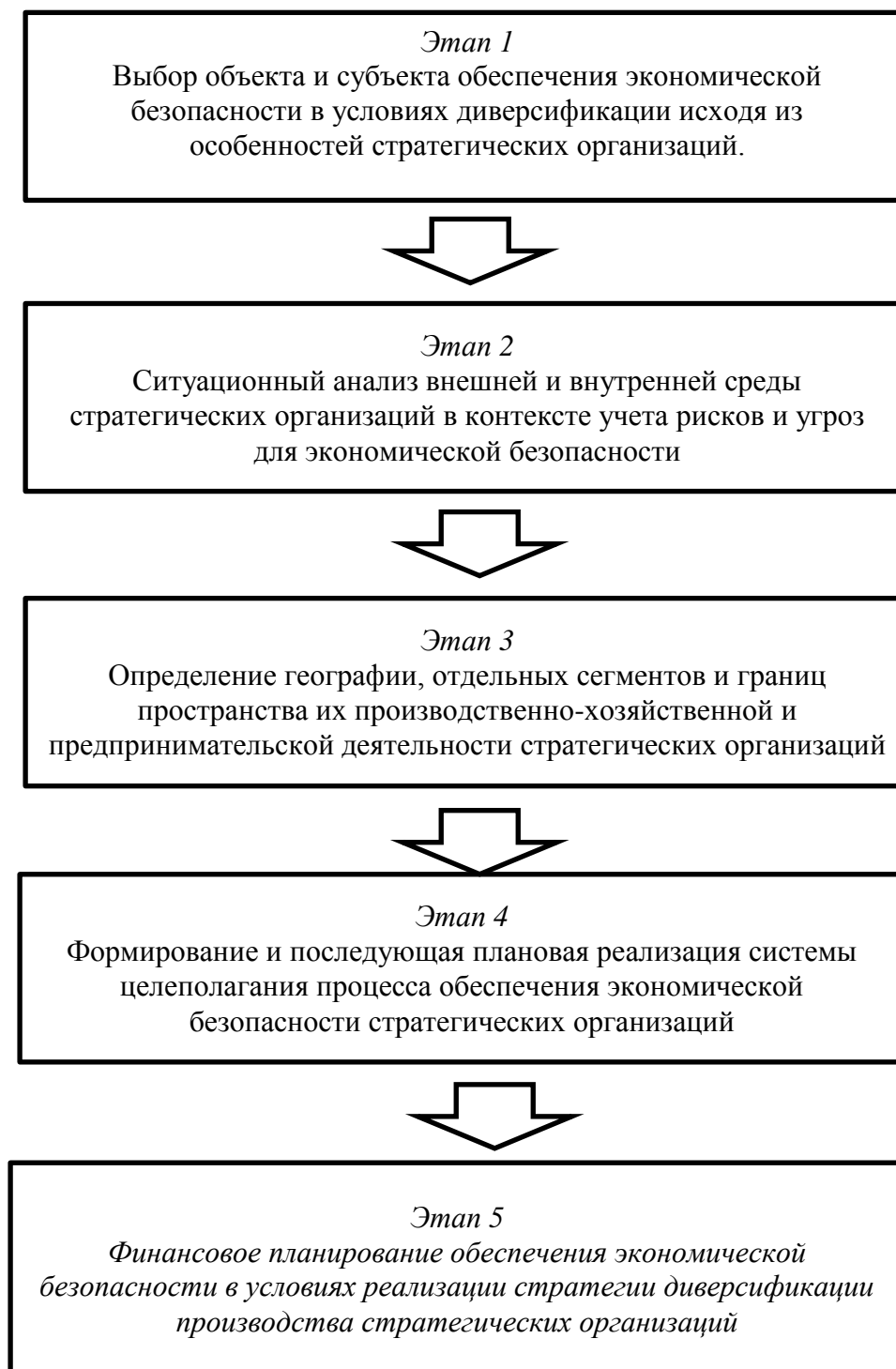
Рисунок 2 -Этапы обеспечения экономической безопасности стратегических организаций в условиях реализации стратегии диверсификации производства

Процесс обеспечения экономической безопасности стратегических организаций в условиях реализации стратегии диверсификации производства, имеющего в своем составе предприятия, производящие различные виды продукции военного и гражданского назначения, осуществляется на основе алгоритма, включающего следующие этапы (рисунок 2).