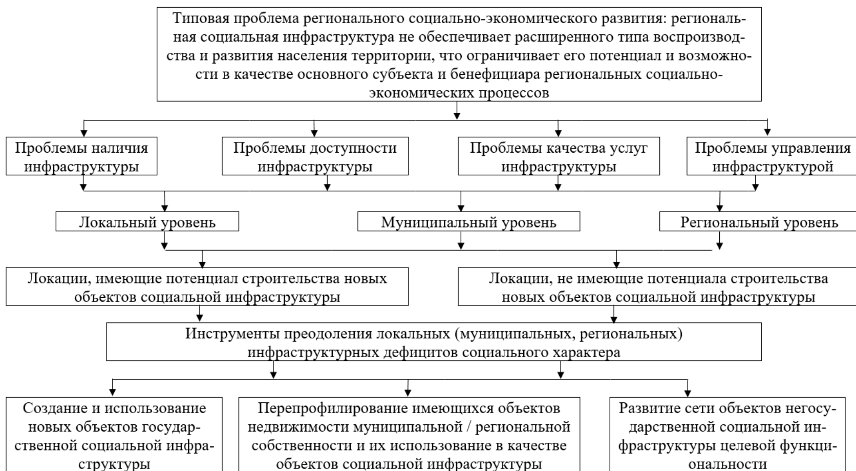
Рисунок 3 – Авторская классификация основных проблем функционирования локальной социальной инфраструктуры и инструментов для преодоления инфраструктурных дефицитов