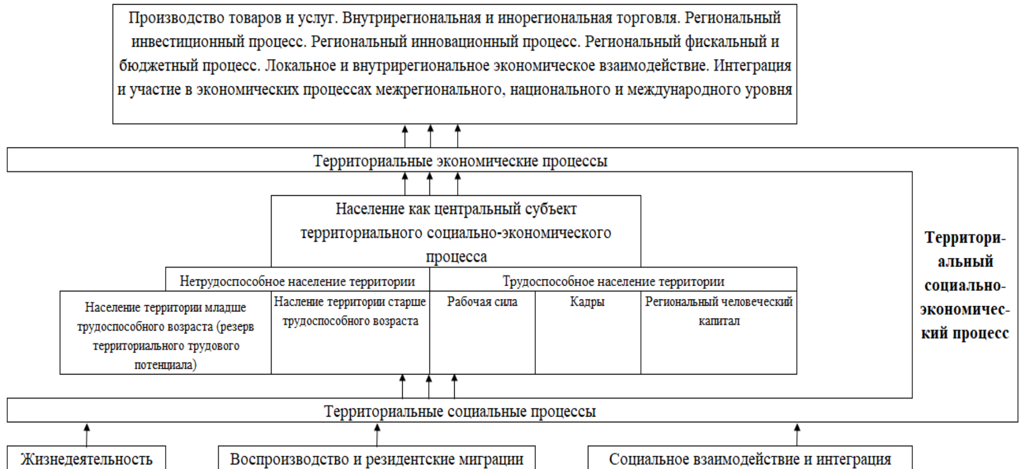
Рисунок 1 – Население как основной инициатор и бенефициар системы социальных и экономических процессов территории