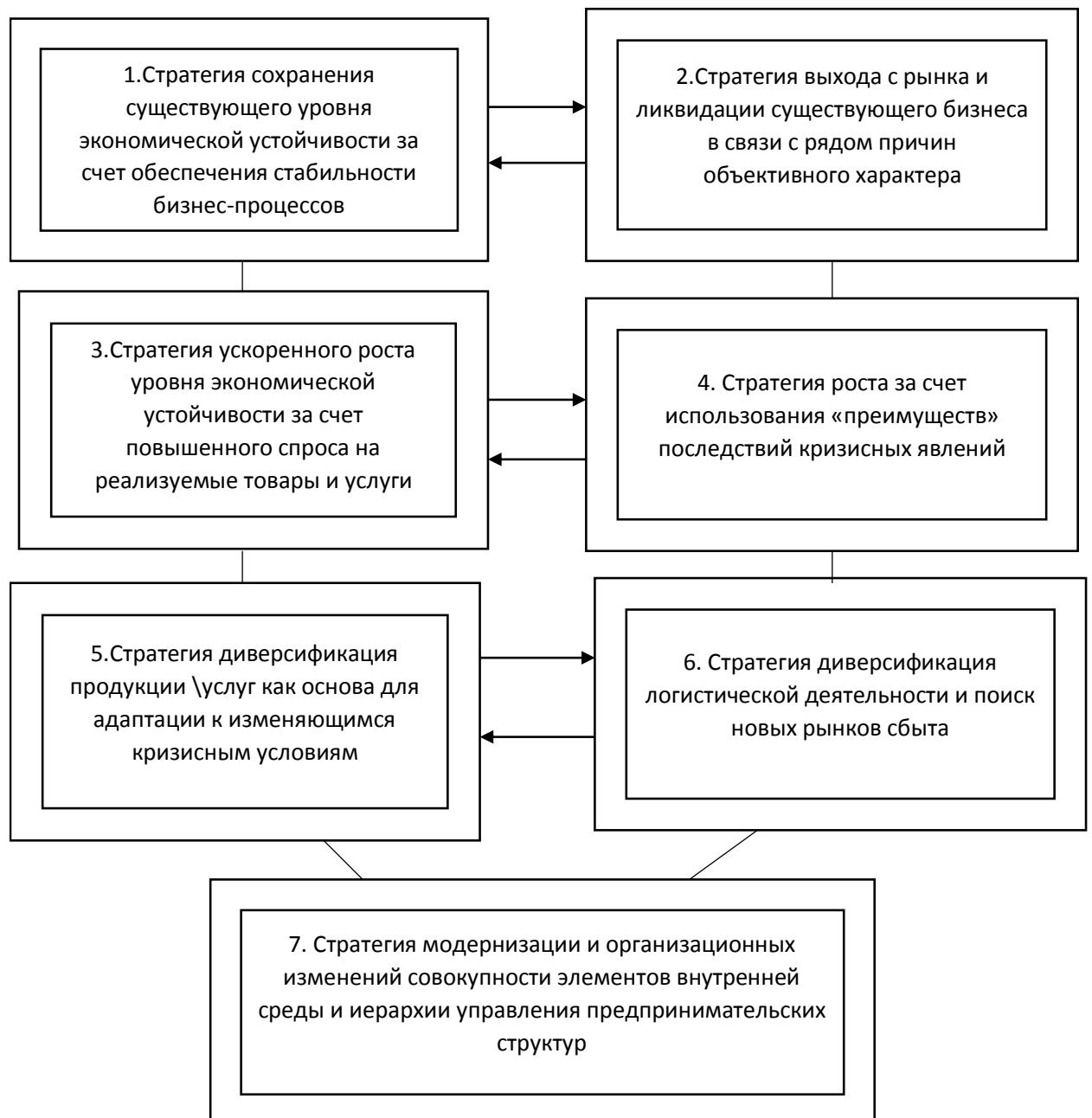
Рисунок 4 - Ключевые стратегии, ориентированные на повышение уровня интегрированной экономической устойчивости предпринимательской структуры в условиях кризиса

На рисунке 4 автором представлены ключевые стратегии, ориентированные на повышение уровня интегрированной экономической устойчивости предпринимательской структуры в условиях кризисных ситуаций и явлений.