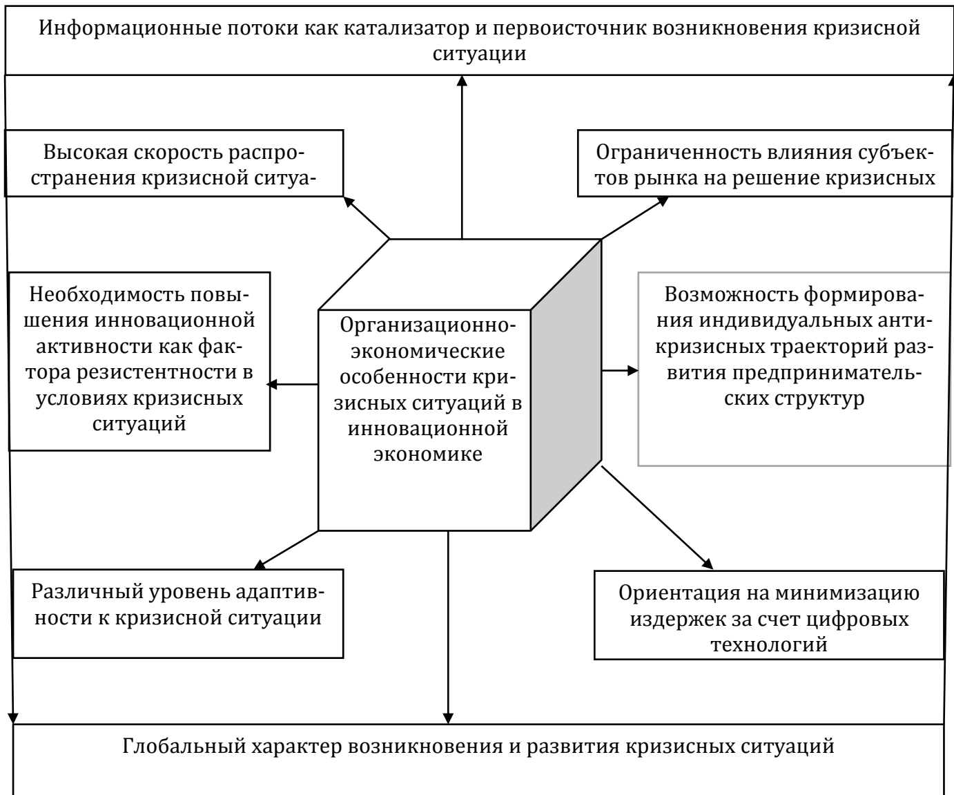
Рисунок 1- Организационно-экономические особенности кризисных ситуаций в инновационной экономике

В условиях инновационной экономики снижение кризисных явлений возможно только посредством тесного взаимодействия между всеми участниками рынка на основе использования цифровых технологий и повышения уровня персональной социальной ответственности за принятие тех или иных управленческих решений. В противном случае, можно наблюдать лишь дальнейшее ухудшение экономического кризиса, способного перейти за рамки исключительно снижения уровня деловой активности и роста показателей макроэкономической нестабильности и приобрести черты социально-экономической катастрофы.