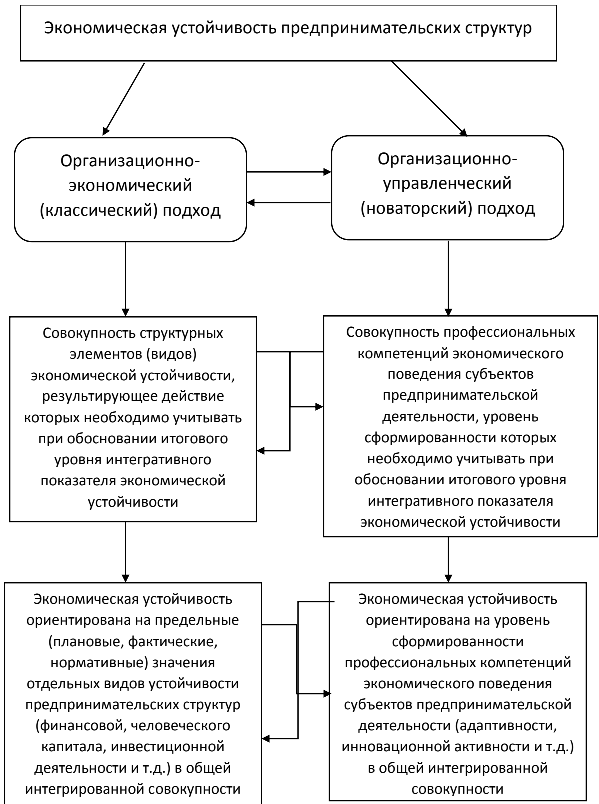
Рисунок 3- Сравнительная характеристика основных методических подходов к оценке экономической устойчивости предпринимательских структур

каторов экономической интегрированной устойчивости и учета влияния кризисных условий, а также особенностей инновационной экономики.