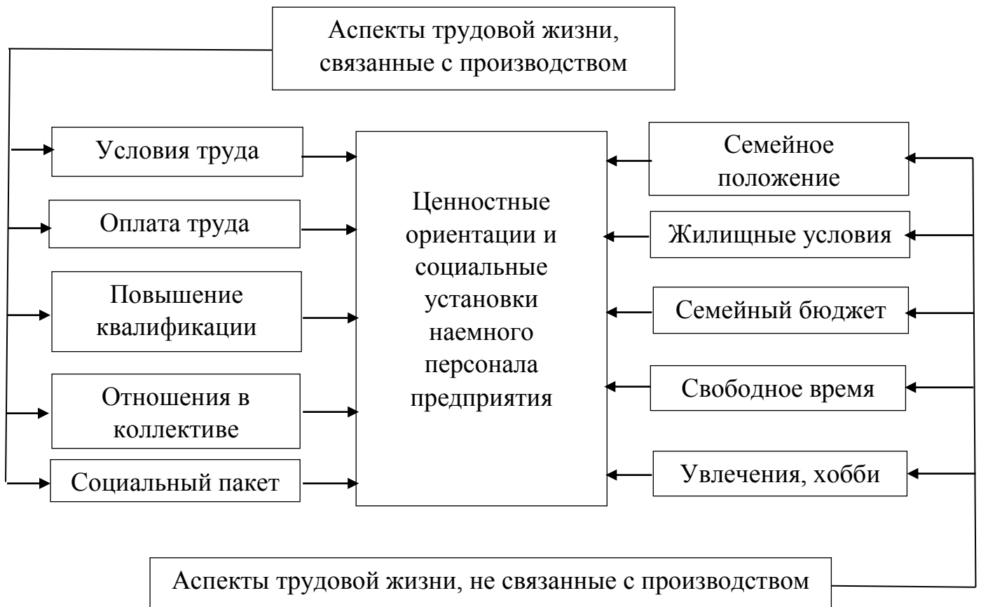
Рисунок 2. Единство производственного и внепроизводственного поведения в УЧР

В исследовании осуществлялся анализ таких характеристик работников как пол, возраст, образование, семейное положение, состав семьи и т.п., а также собирались данные о социально-экономическом положении работников, включая размеры и источники дохода, основные статьи расходов, материальные потребности работника и его семьи, характер жилья и ряд других характеристик. Исследование проводилось на предприятиях автопрома, использующих конвейерные технологии. Труд на конвейере в условиях навязанного ритма и трехсменной работы резко ограничивает возрастные возможности использования наемного труда: работники 20-23 лет составляют 11,3% общей численности персонала, 24-27 лет - 37%, 28-30 лет - 20,65%, 31-35 лет - 17,2, более 40 лет – менее 3%. Соответственно работодатель понимает, что за достаточно короткий временной отрезок предприятие должно: адаптировать – обучить - получить максимально возможную отдачу – спланировать карьеру работника, а работник должен максимально удовлетворить основные жизненные потребности за короткий промежуток времени. Предприятия с иностранным капиталом решают проблему за счет развития социальных программ: удовлетворены