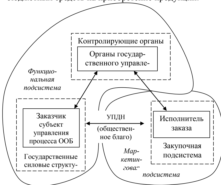
Рис. 2. – Современная структурная модель системы государственных заказов с применением маркетингового подхода

Важным элементом развития регионального предпринимательства, с этой точки зрения, стал переход на конкурсные методы размещения заказов. Однако, конкурс не является гарантом эффективности государственных заказов. Поэтому целесообразно использовать современные методы точной (в том числе маркетинговой) настройки конкурсного механизма. Маркетинговый подход в деятельности государственного заказчика будет минимизировать риск рыночной неопределенности и неэффективного расходования бюджетных средств на приобретение продукции.