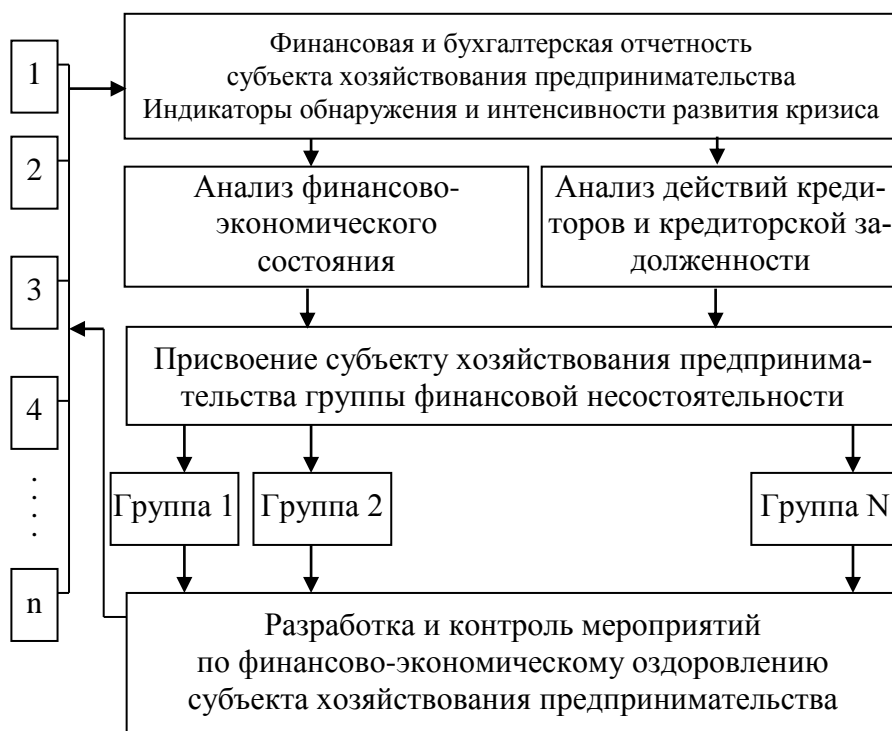
Рис. 2. Структура САМР субъекта хозяйствования предпринимательства

Реализация САМР ведет к достижению следующих целей: