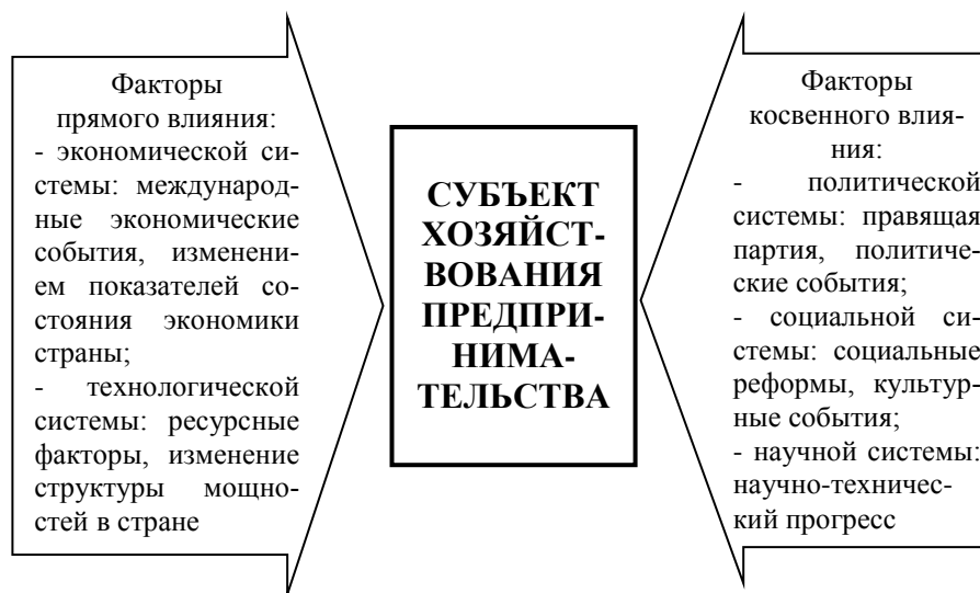
Рис. 1. Принципиальная схема факторов внешней среды субъекта хозяйствования предпринимательства

В диссертации механизм управления субъектом хозяйствования предпринимательства понимается как совокупность практически исполнимых управленческих приемов в области организации, технологии, методического инструментария управления, направленных на достижение его предпринимательской цели.