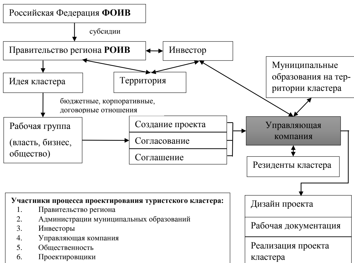
Рисунок 3 – Механизм функционирования туристско-рекреационного кластера на территории региона

В организационно-правовой модели ТРК «Гора Белая» (рис. 4) представлены три уровня: национальный в лице федеральных органов исполнительной власти, региональный в лице губернатора и правительства региона, региональных органов исполнительной власти и локальный уровень в лице управляющей компании туристско-рекреационного кластера. Взаимоотношения между ними основаны, прежде всего, на бюджетных отношениях при предоставлении федеральных и региональных субсидий, а с резидентами кластера – на корпоративных и договорных отношениях.