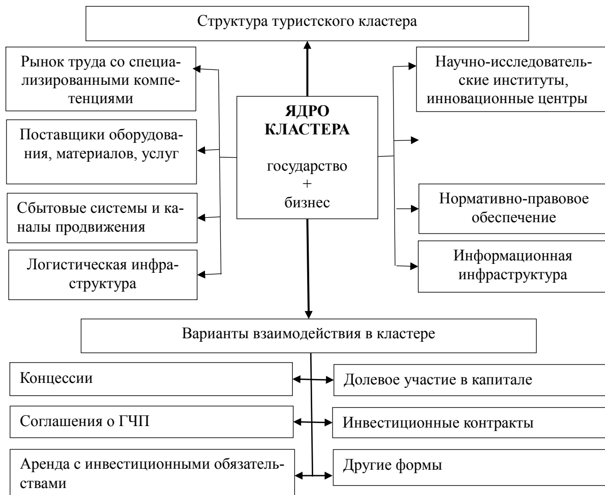
Рисунок 1 – Модель взаимодействия кластерной сети в региональной экономике

В диссертации предложена схема модели взаимодействия кластерной сети в региональной экономике (рис. 1), результаты которой могут быть применены при решении общих и частных стратегических задач и операционных планов предпринимательских структур в кластерных сетях.