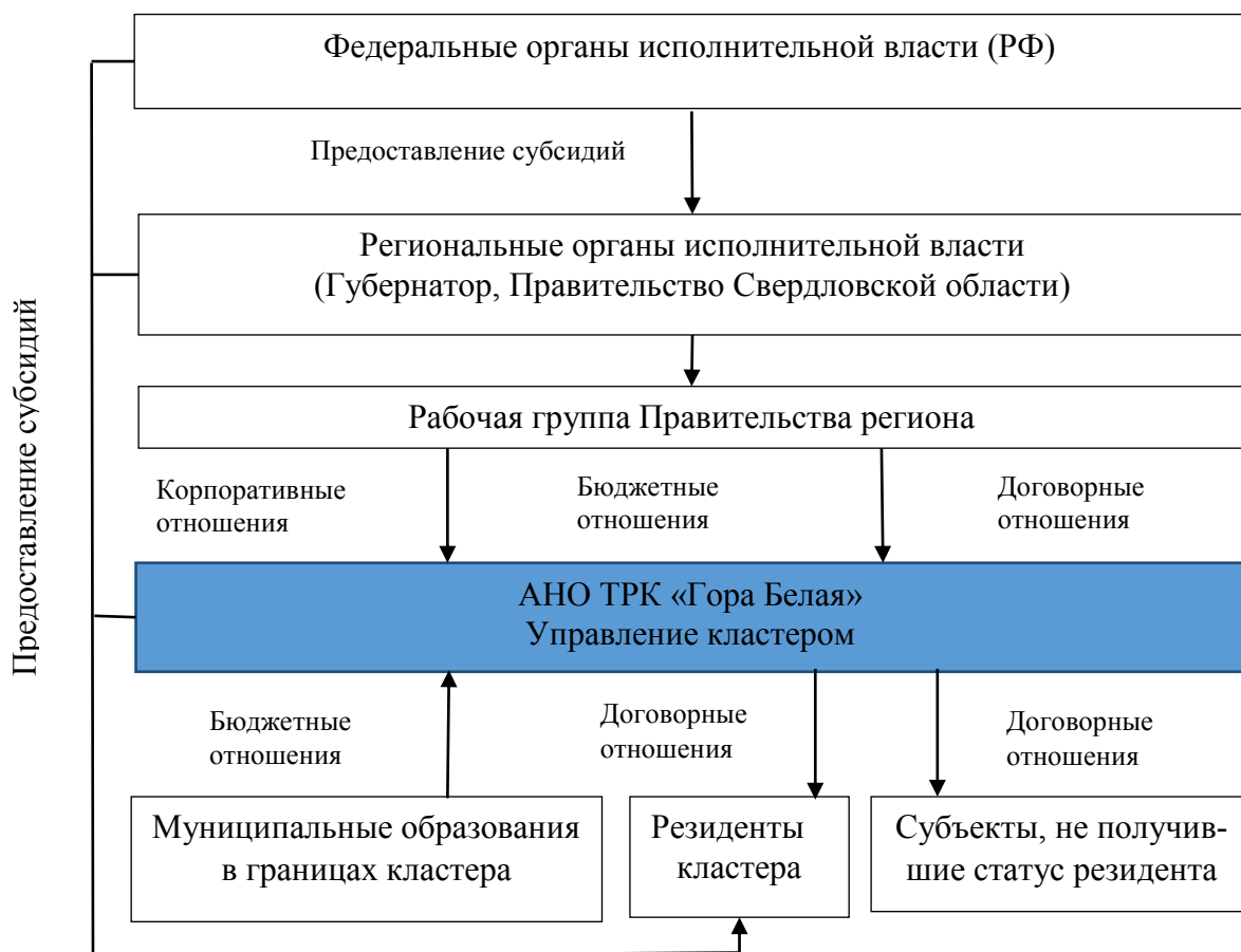
Рисунок 4 – Организационно-правовая модель создания туристско-рекреационного кластера в Свердловской области