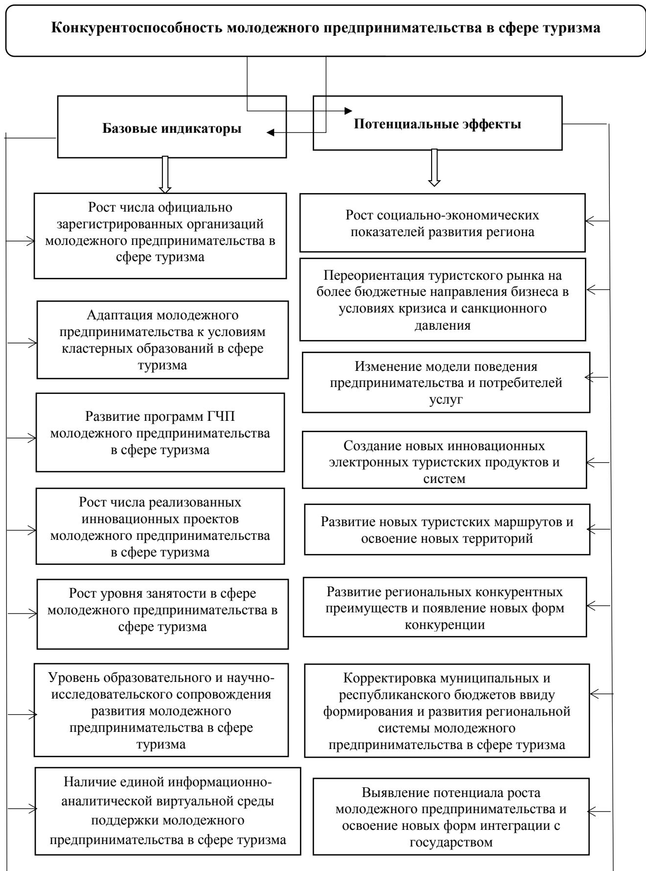
Рисунок 3.2 - Ключевые направления развития конкурентоспособности молодежного предпринимательства в сфере туризма (авторские разработки).