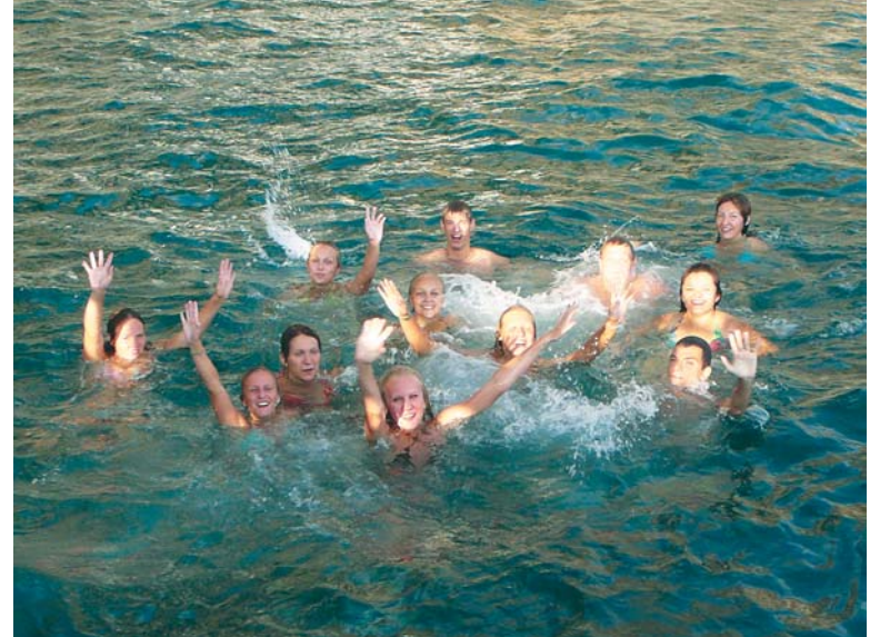
По традиции минувшим летом студенты Финэка отлично отдохнули по путевкам в различные пансионаты и санатории, предоставленные социальным отделом университета.

Любителей спорта с радостью примет Межвузовский спортивно-оздоровительный комплекс, где работают секции по баскетболу, футболу, плаванию, теннису, греко-римской борьбе, легкой атлетике. Любителей головоломок приглашают на тренировки в клуб для эрудитов «Что? Где? Когда?». Любителей музыки, танцев и просто артистичных студентов с радостью примет студклуб. А если тебя, первокурсник, интересует последние тенденции и процессы в мире, то участвуй в дебатах, которые проводят старшекурсники. Всех, кто интересуется иностранными языками, ждут курсы, на которых вы сможете не только «подтянуть» свой английский, немецкий, французский, но и познакомиться с финским, китайским, японским и многими другими языками.