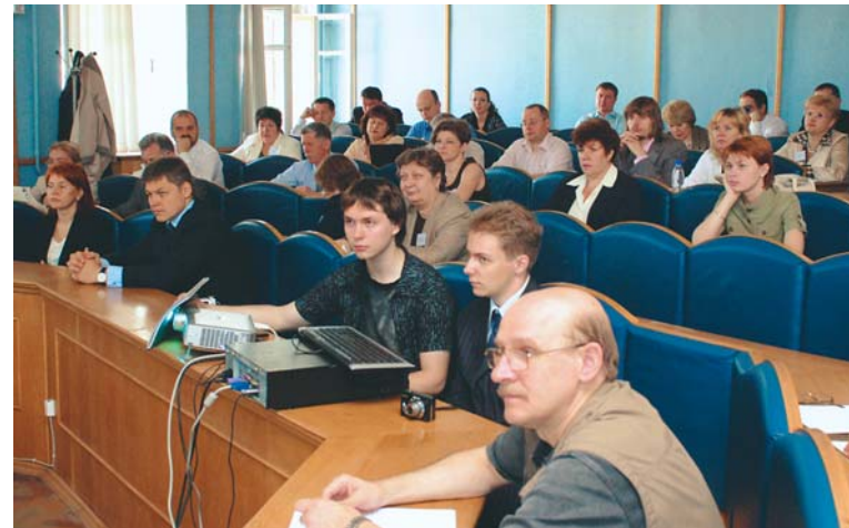
(Окончание. Начало на стр. 1)

Основные доклады участников, направленные на масштабное всестороннее осмысление всей сложности развития страхового рынка страны, можно условно разделить на четыре группы: