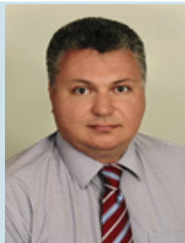
Кучинский Дмитрий Петрович, Глава администрации Копорского сельского поселения