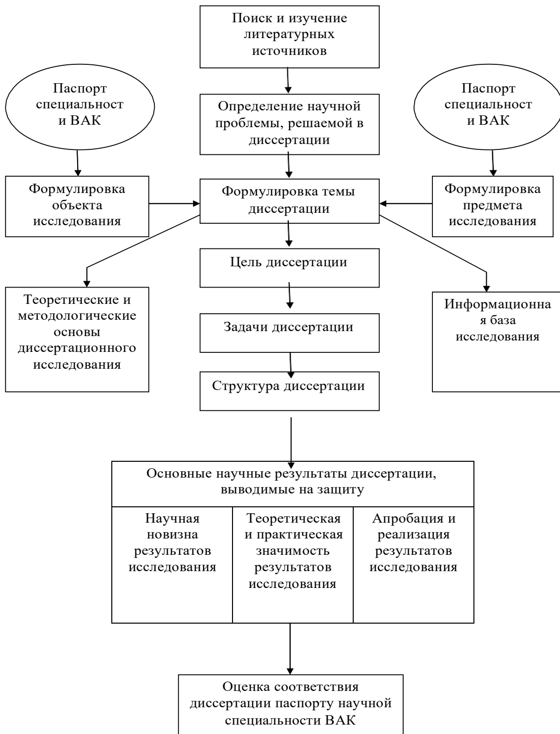
Рисунок 1. Принципиальная схема диссертационной работы

Ниже представлены пояснения по реализации основных блоков принципиальной схемы.