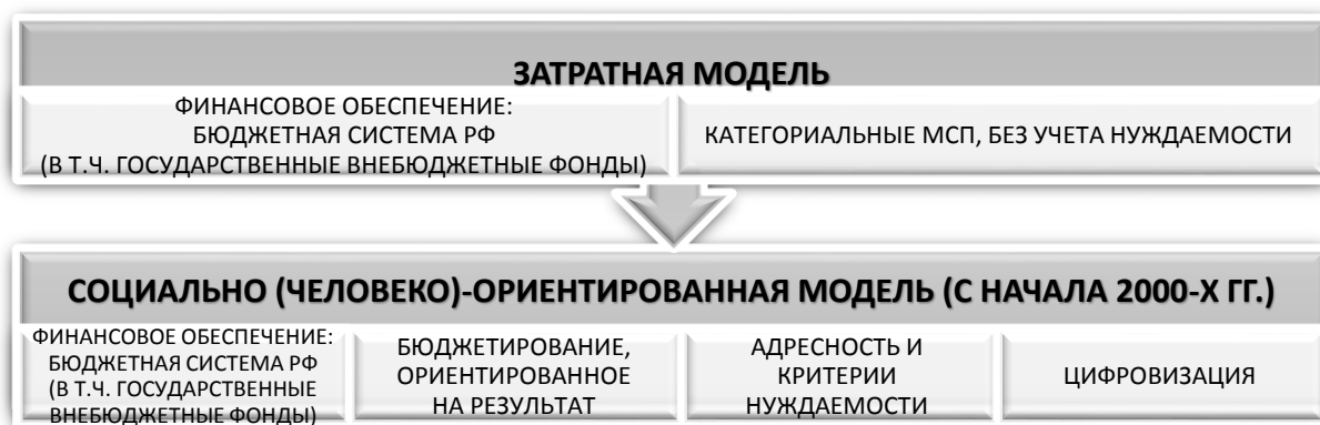
Рисунок 1. Трансформация системы социальной защиты России - переход на социально (человеко)-ориентированную модель

1. Предложена периодизация новейшей истории развития системы социальной защиты населения в России с позиции генезиса источников её финансового обеспечения, что позволило идентифицировать период радикального обновления или трансформации – начало 2000-х гг. по настоящее время, характеризующийся переходом от затратной к социально (человеко) - ориентированной модели системы социальной защиты населения, включая модель финансового обеспечения социальной защиты, основанной на применении критериев нуждаемости и соблюдении принципа адресности, с использованием информационных технологий. На основе теоретического анализа нормативных правовых актов и научных трудов, были выделены основные этапы развития системы социальной защиты в России, связанные в том числе с развитием источников её финансового обеспечения (древнерусский, дореволюционный, послереволюционный, постперестроечный, новейший), идентифицирован современный этап трансформации системы социальной защиты населения (рисунок 1).