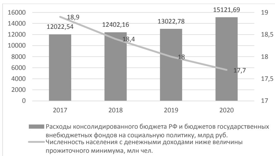
Рисунок 3. Сравнительная динамика показателей расходов консолидированного бюджета РФ и бюджетов государственных внебюджетных фондов на социальную политику и уровня бедности в России

Автор убежден, что необходимо направлять бюджетные средства именно тем категориям граждан, которые действительно нуждаются в социальной поддержке, для чего требуется усовершенствовать процесс назначения гражданам МСП с целью сокращения неэффективного расходования бюджетных средств (рисунок 3).