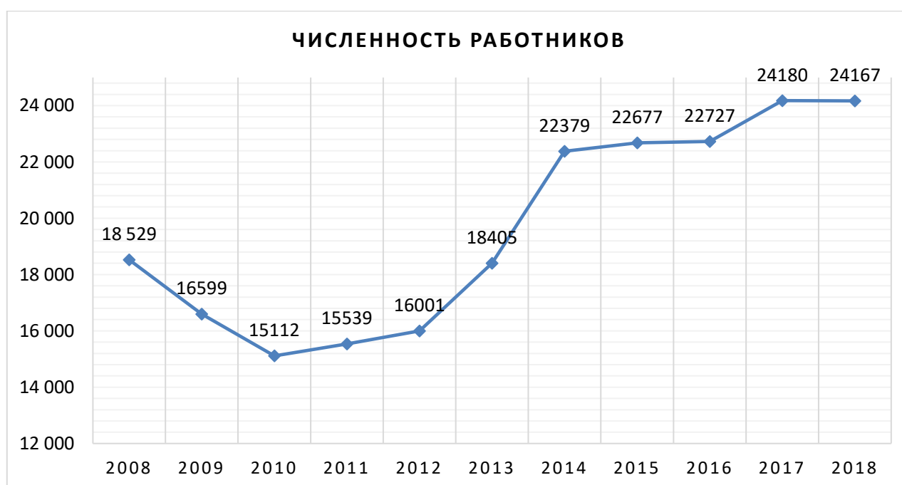
Рис. 1. Динамика численности работников за последние 10 лет, чел

На рис. 1 представлена динамика численности работников ПАО «УМПО» за последние 10 лет [6].