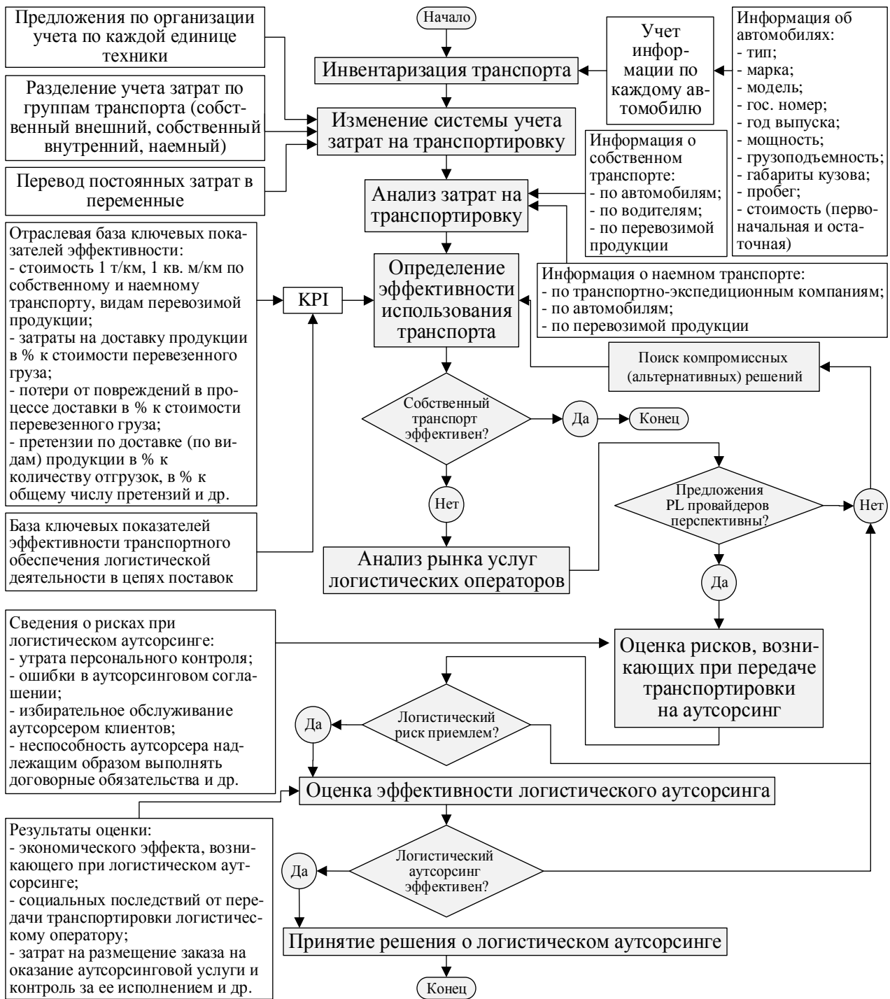
Рисунок 2 – Алгоритм обоснования аутсорсинга в операционной логистической деятельности (транспортировке)

В основу предложенного алгоритма положены авторские рекомендации по совершенствованию системы управленческого учета логистических затрат на транспортировку, которые предусматривают переход на контроль затрат по каждой единице техники и ключевых показателей эффективности транспортного обеспечения логистической деятельности в цепях поставок целлюлозно-бумажной продукции с учетом: мер по повышению точности фиксирования транспортных затрат на перевозку грузов внутри цехов предприятий отрасли и между ними; разделения транспорта на собственный и наемный; вклада автотранспортных цехов в производительность труда на