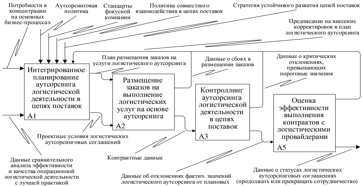
Рисунок 3 – SADT-диаграмма принятия решения о логистическом аутсорсинге в цепях поставок целлюлозно-бумажной продукции

Доказательно обосновывается, что ценность логистического аутсорсинга для цепей поставок достигается через интегрированное планирование, предусматривающее разработку участниками совместной стратегии осуществления взаимодействий с аутсорсерами (логистическими провайдерами) на паритетной основе, для которой определяются условия минимизации рисков и концентрации на операционных и стратегических результатах.