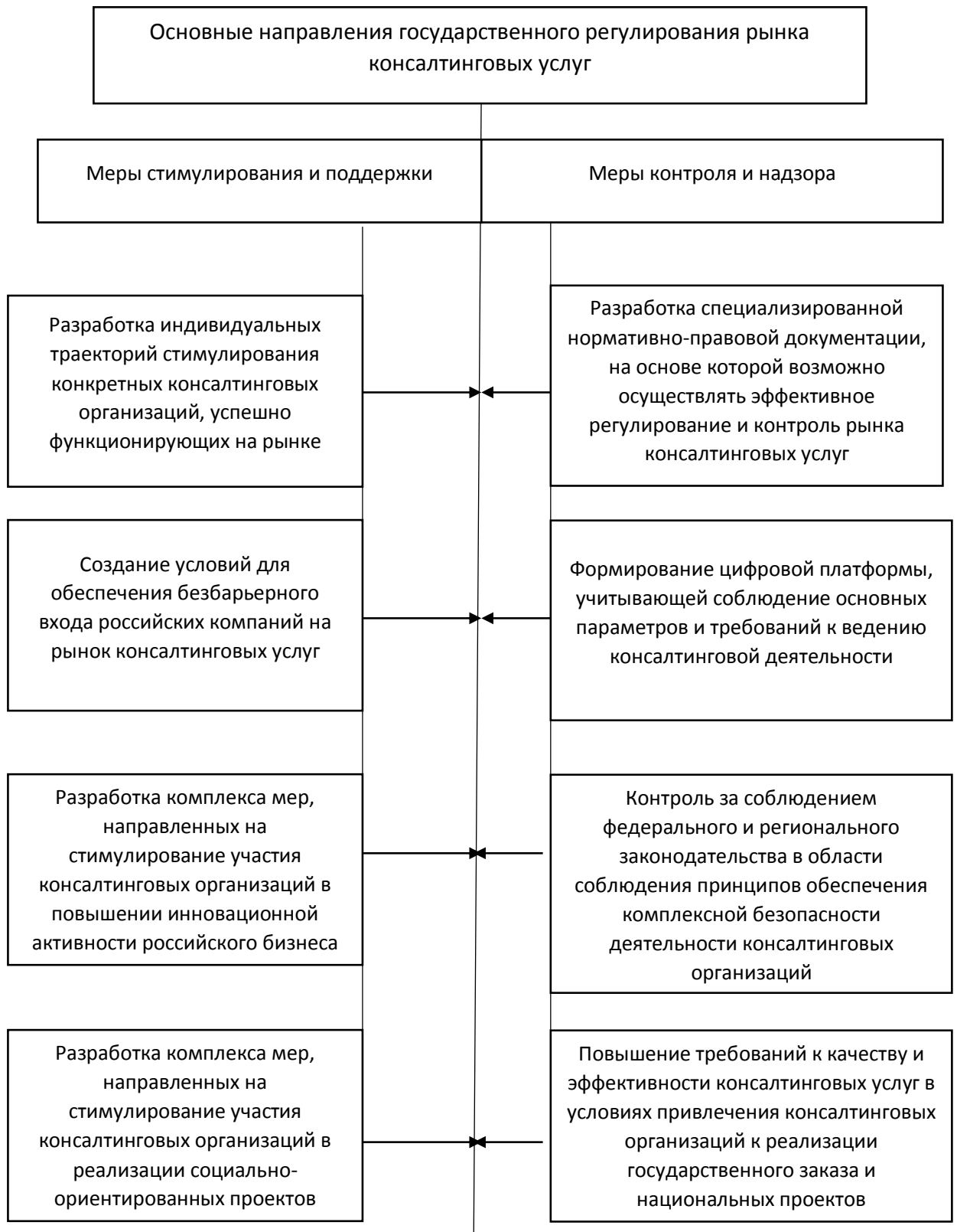
Рисунок 1 - Основные направления государственного регулирования рынка консалтинговых услуг

2. Обоснованы и раскрыты возможные траектории развития деятельности консалтинговых организаций в российских условиях с учетом требований инновационной экономики и цифровизации, в том числе позиционирование на определенном распространенном виде