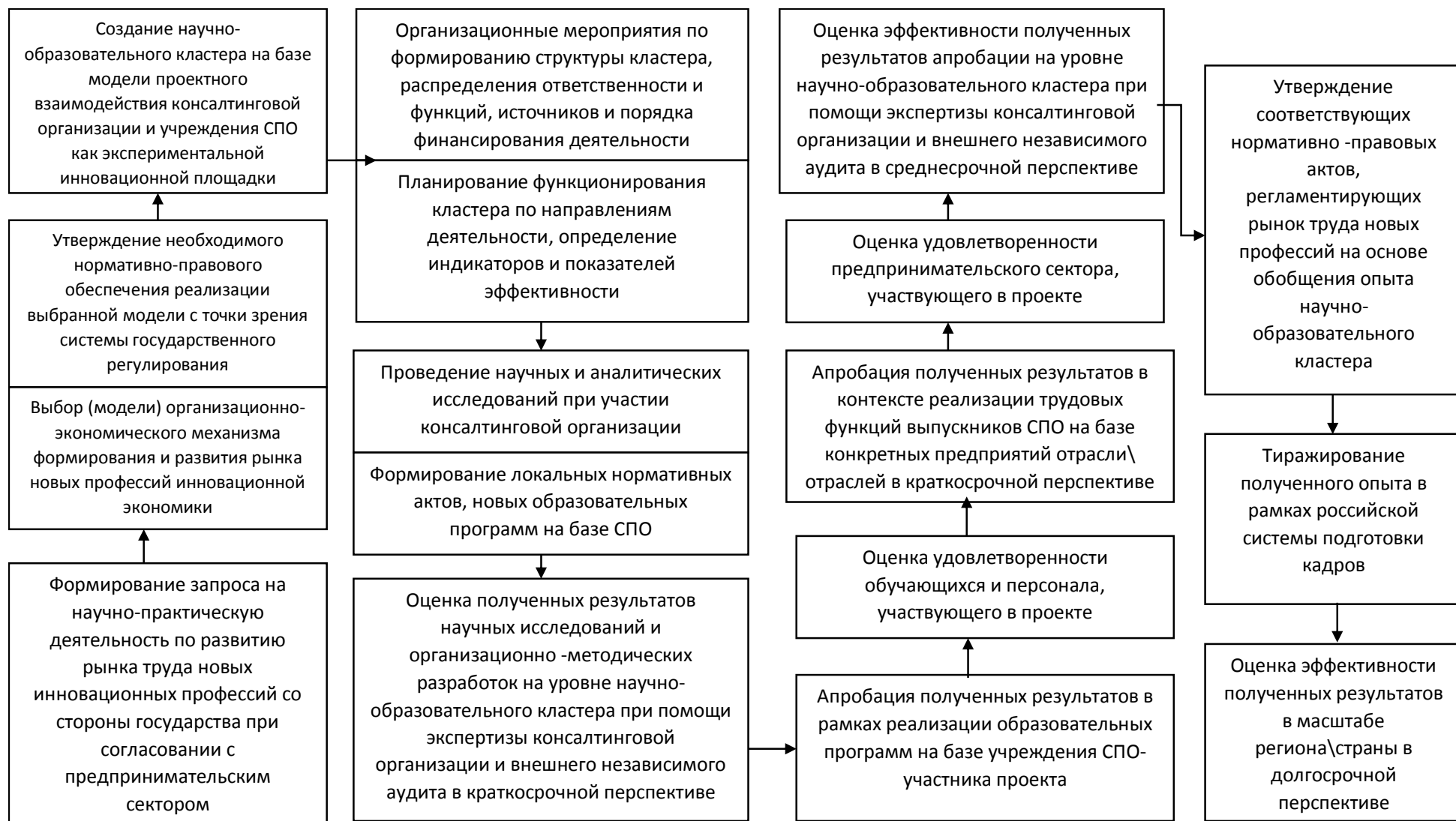
Рисунок 4 - Организационно-экономический механизм формирования и развития рынка новых профессий инновационной экономики на основе взаимодействия консалтинговых организаций и учреждений СПО