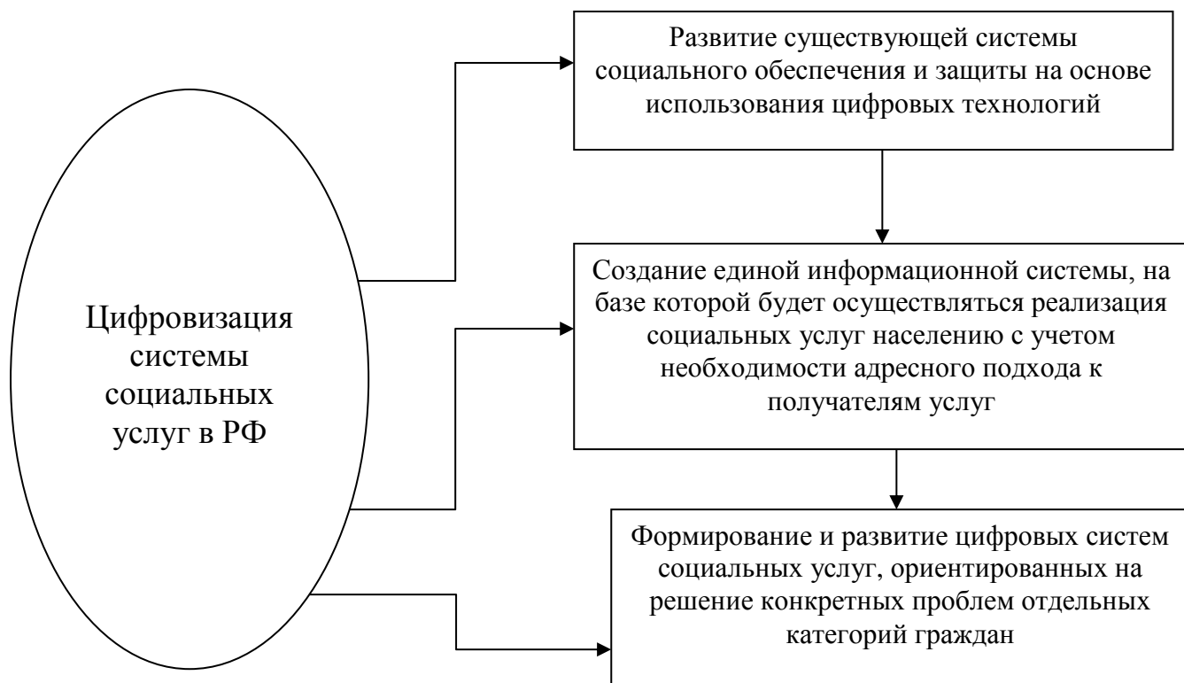
Рисунок 2– Альтернативные варианты цифровизации системы социальных услуг в РФ

Отдельное внимание, в контексте совершенствования социальной политики государства, заслуживают методические аспекты цифровизации системы проектирования и оказания социальных услуг в РФ. Возможные варианты представлены нами на рисунке 2.