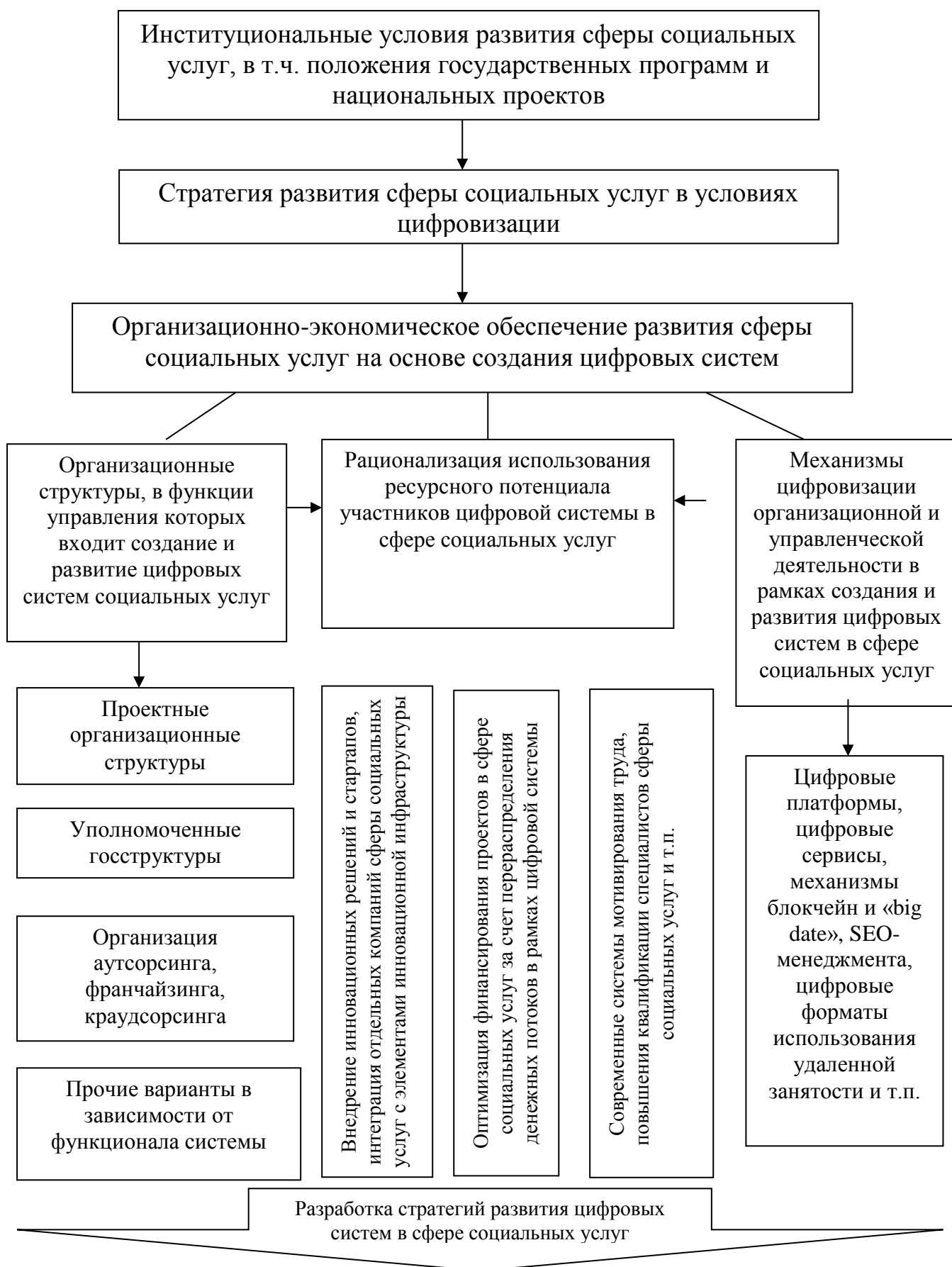
Рисунок 1 - Основные элементы организационно-экономического обеспечения развития сферы социальных услуг на основе создания цифровых систем