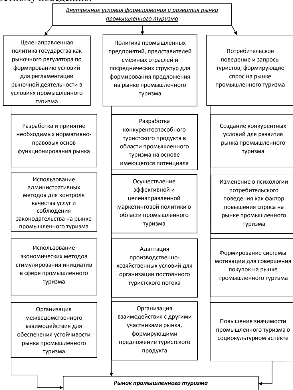
Рисунок 1 – Характеристика внутренних условий формирования и развития рынка промышленного туризма

3. потребителей туристских продуктов, которые не только будут склонны к приобретению соответствующих туров в долгосрочной перспективе на постоянной основе, но и мотивированы к совершению покупки в связи с жизненными потребностями и привычкой к соответствующему ценностному поведению.