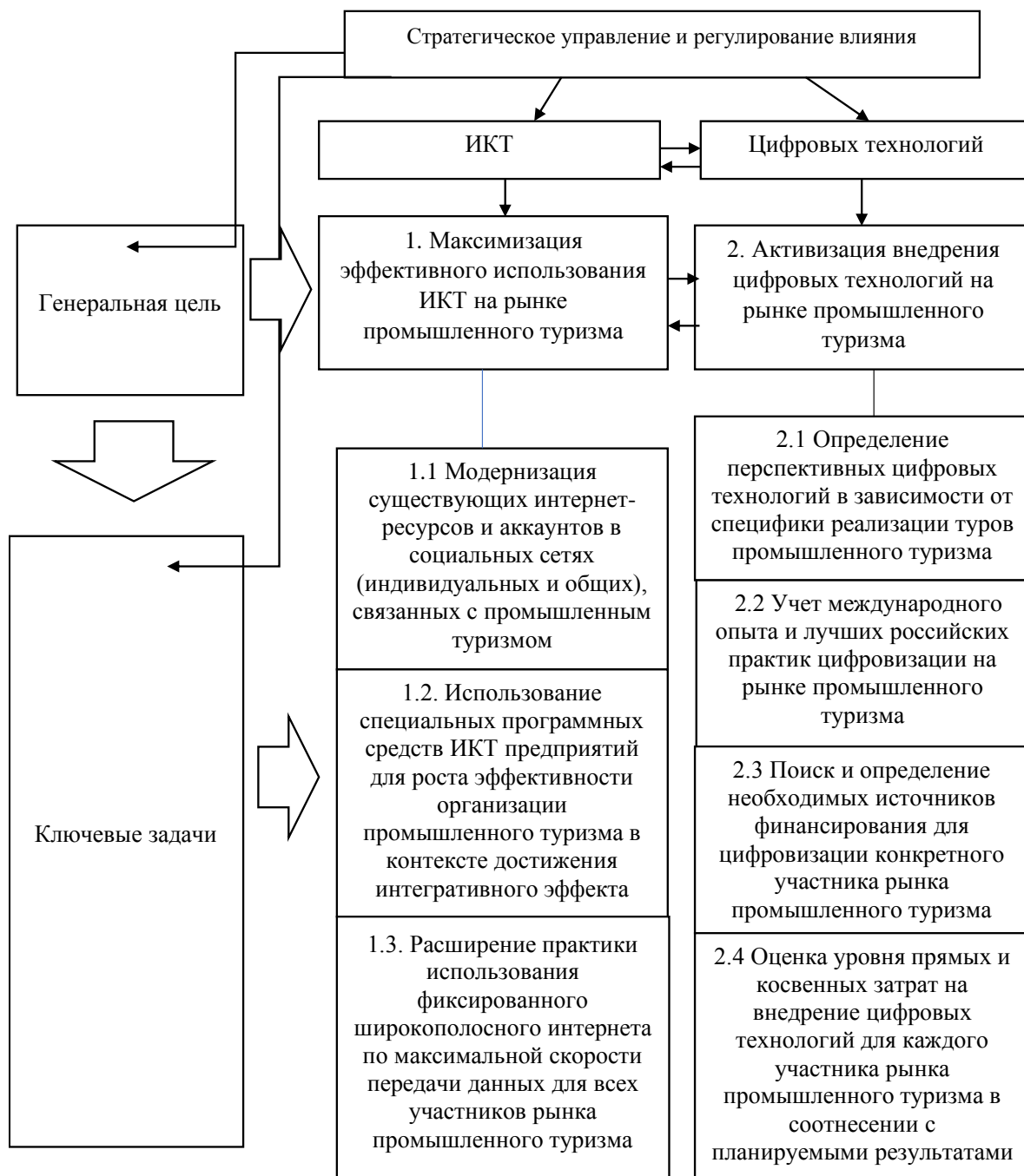
Рисунок 3 – Стратегические цели и задачи использования информационно-коммуникационных технологий и цифровых технологий на рынке промышленного туризма в России

условное разделение уровня влияния и направлений использования ИКТ и цифровых технологий способствует более четкой характеристике возможных эффектов от их разработки и внедрения на рынке промышленного туризма и позволяет принимать более взвешенные управленческие решения на уровне отдельных участников рынка. Подводя итог вышесказанному, можно обозначить ключевую цель и соответствующие задачи, связанные с управлением и регулированием влияния ИКТ и цифровых технологий на рынке промышленного туризма в России (рисунок 3).