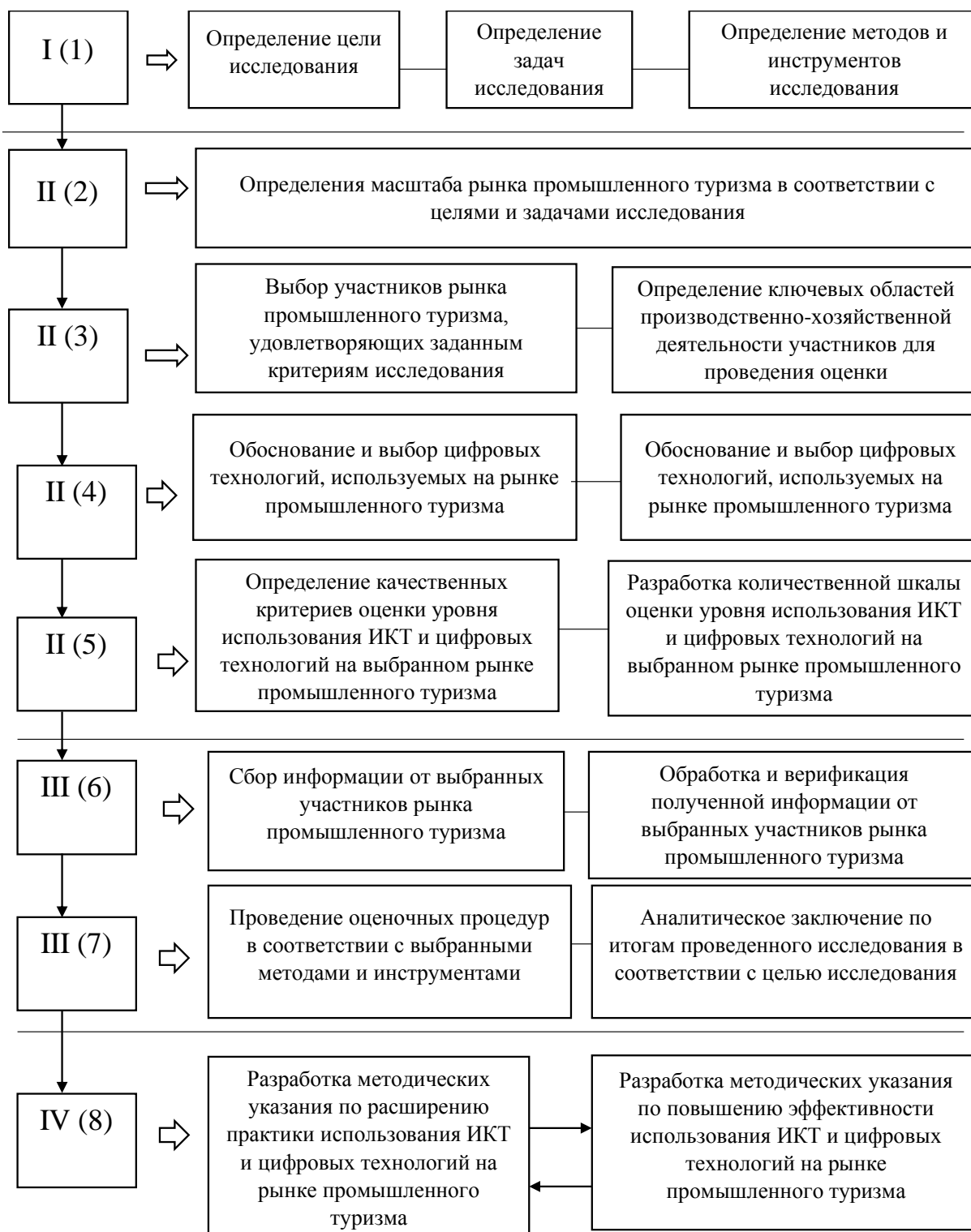
Рисунок 4- Этапы методики оценки уровня использования ИКТ и цифровых технологий на российском рынке промышленного туризма

В качестве региона исследования выступила Тульская область. Данный регион был выбран как исходя из собственных знаний и представлений автора об уровне развития промышленного туризма, так и с точки зрения высоких позиций субъектов регионального рынка на национальном уровне в контексте