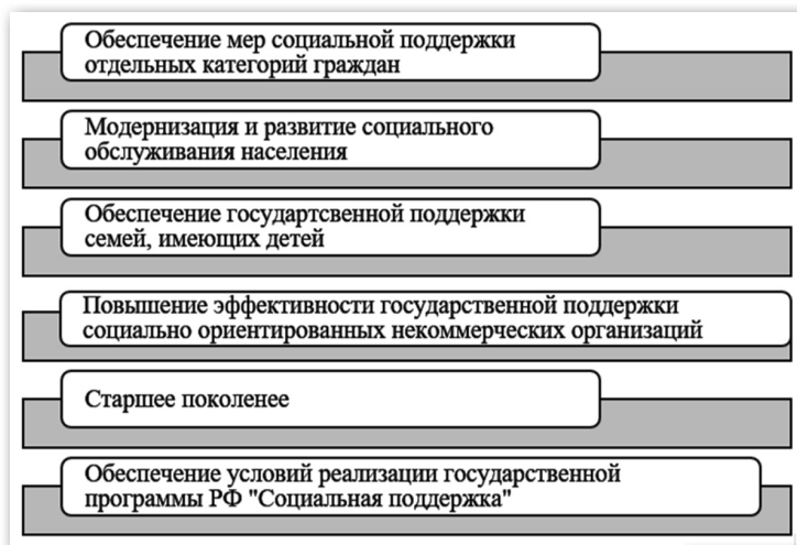
Рисунок 1 — Федеральные программы поддержки нуждающихся, целевые программы [2]

Проект также опробовал адаптивную модальность, которую можно масштабировать для повышения устойчивости к отсутствию продовольственной безопасности. Во время конфликта удовлетворение гуманитарных потребностей имеет решающее значение для спасения жизней и удовлетворения основных потребностей, но защита человеческого капитала не менее важна для постконфликтного восстановления и реконструкции [4].