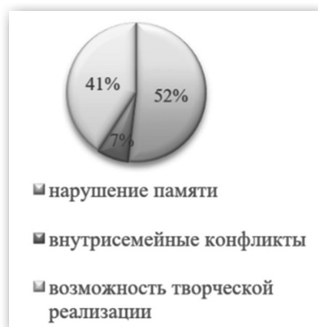
Рисунок 1 — Причины необходимости освоения техник «Зарядка для ума» и «Фитнес для мозга»

Внедренный госаблик в социальной сети «ВКонтакте» ГБУСОН «КЦСОН Пушкинского района» позволил частично решить данную проблему и на текущий момент в группе 654 участника. Для эффективной социальной адаптации пожилых людей необходим комплексный подход, включающий как поддержку со стороны государства