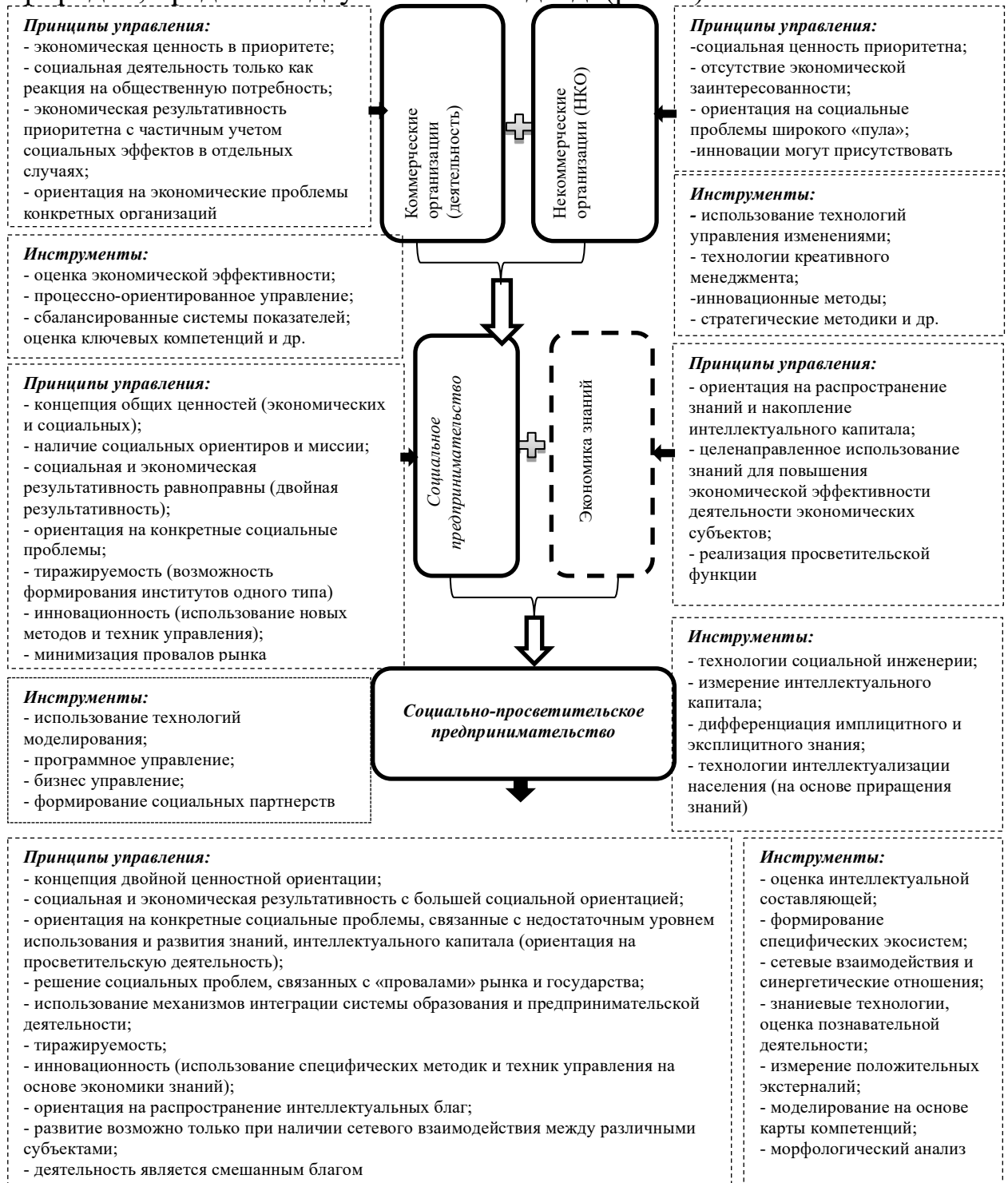
Рисунок 1 – Концептуальная схема выделения социально-просветительского предпринимательства как нового вида предпринимательства

природой, предложен двухэтапный подход. (рис. 1).