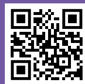
Официальный сайт Росмолодежи