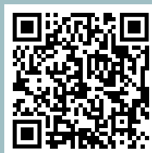
Бакалавриат и специалитет

Узнать подробнее о приемной кампании 2026 года, программах обучения, дате приема документов, подготовительных курсах и о многом другом можно здесь: